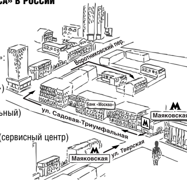
Схема расположения Центра технического обслуживания «СиЭс Медика»

«СиЭс Медика» в г. Москва: пн-пт: с 09.30 до 19.00 (без перерыва на обед), сб: с 10.00 до 18.00 (без перерыва на обед), вс и праздничные дни – выходной